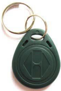
Рис. 1. Метка стандарта EM-Marine

Для открытия дверей и калиток будут использоваться существующие метки (рис. 1), выданные ранее для доступа в парадные.