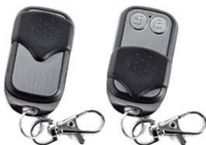
Рис. 2. Брелок

2) или воспользоваться брелоком (Рис. 2.), для автоматического открытия шлагбаума, которые приобретаются отдельно. Брелок представляет собой радиопередатчик с уникальным идентификатором для открытия шлагбаума.